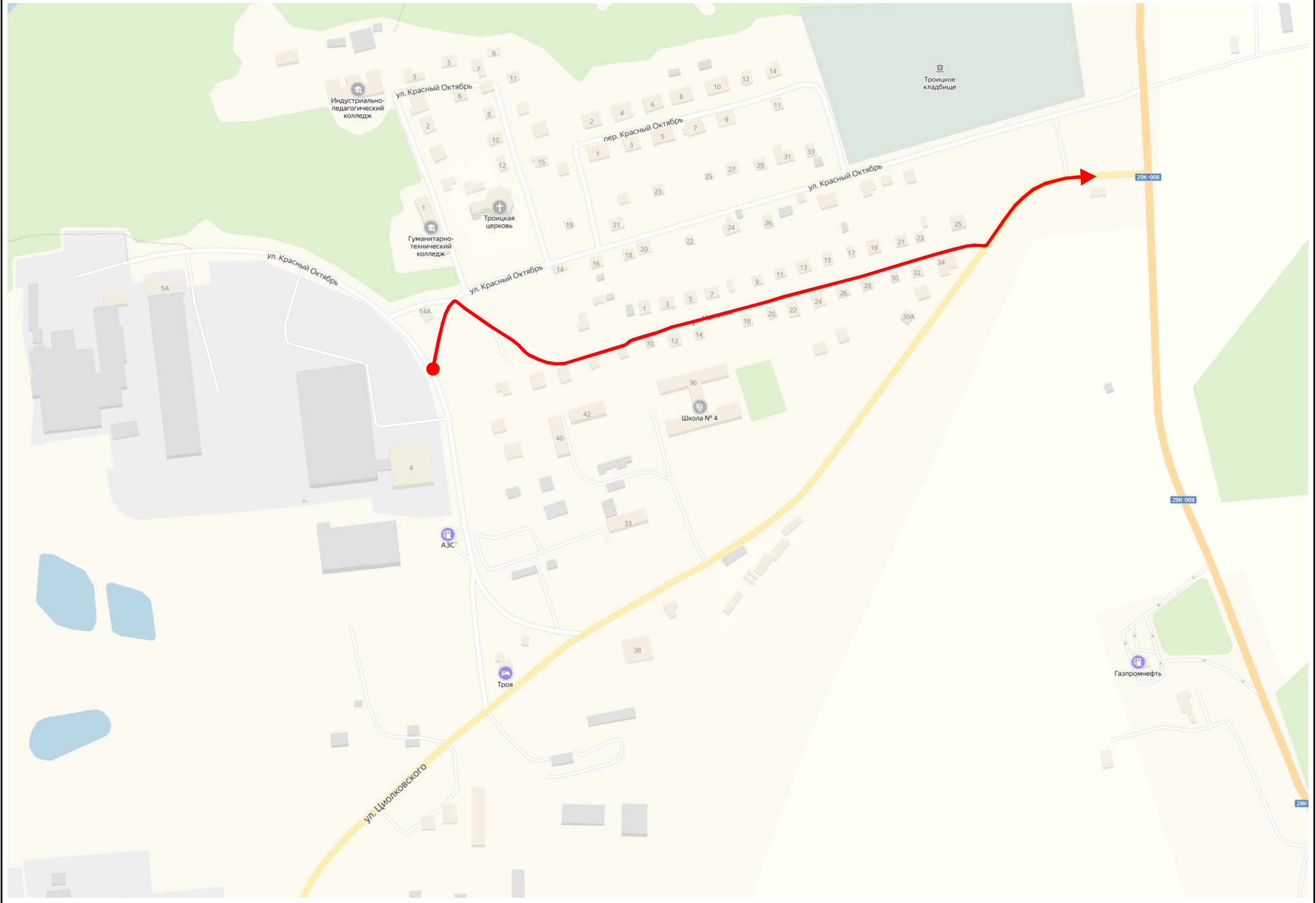
Схема автомобильной дороги г. Кондрово, ул. Чапаева