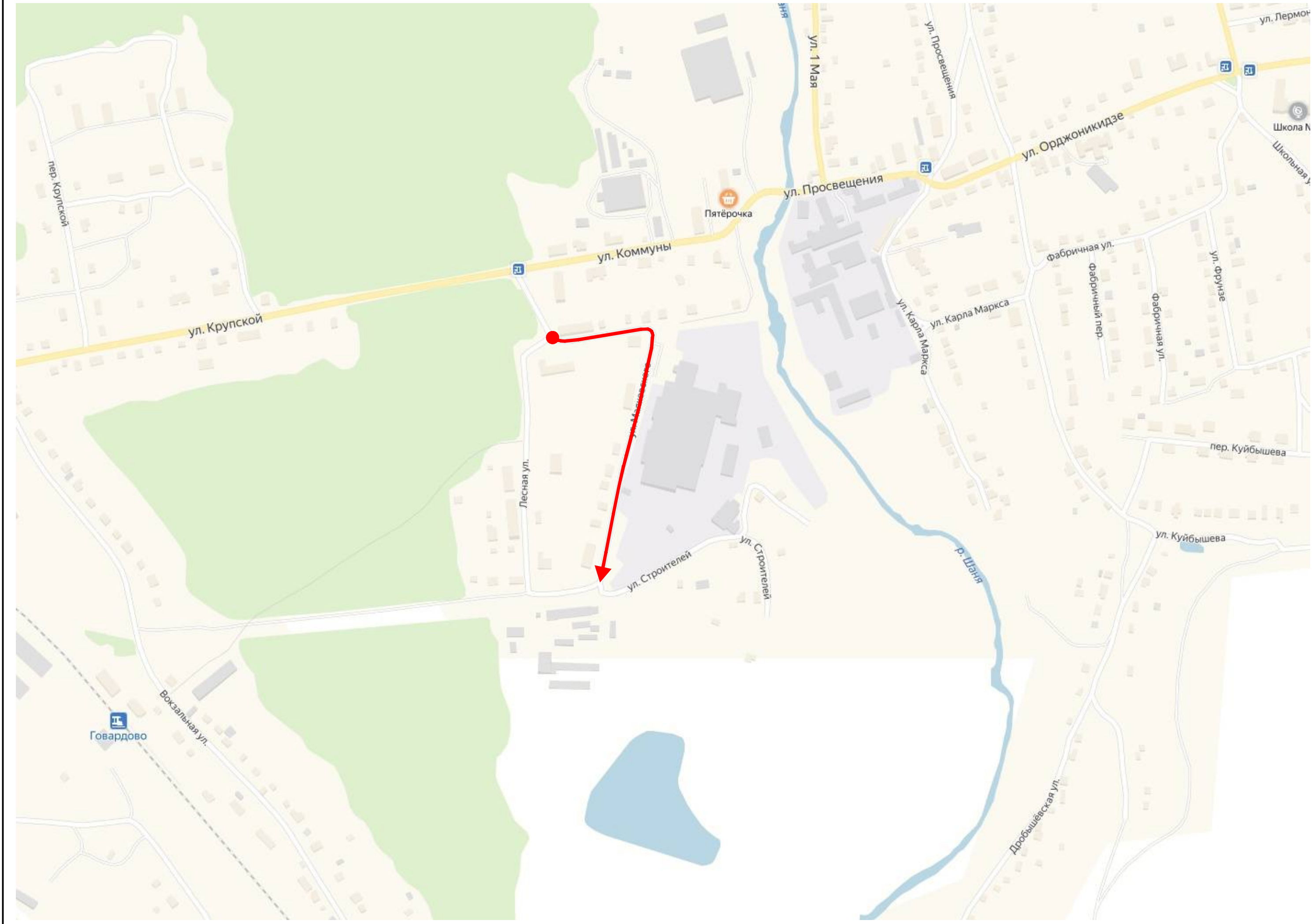
Схема автомобильной дороги г. Кондрово, ул. Маяковского