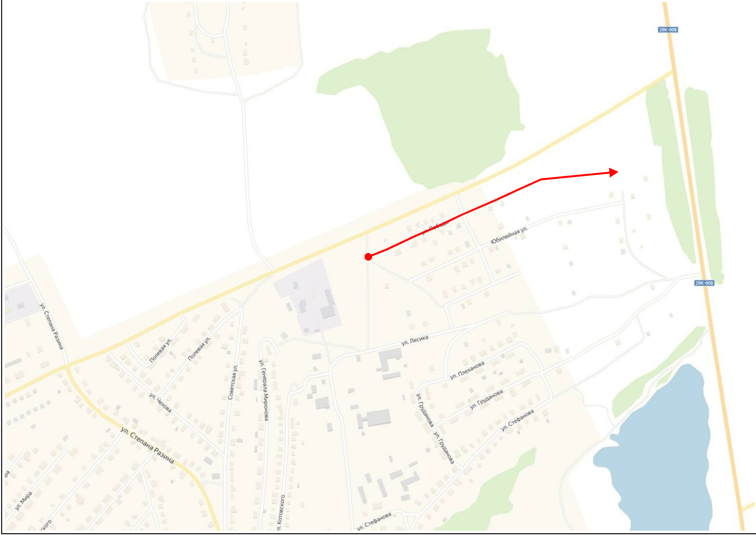
Схема автомобильной дороги г. Кондрово, ул. Победы