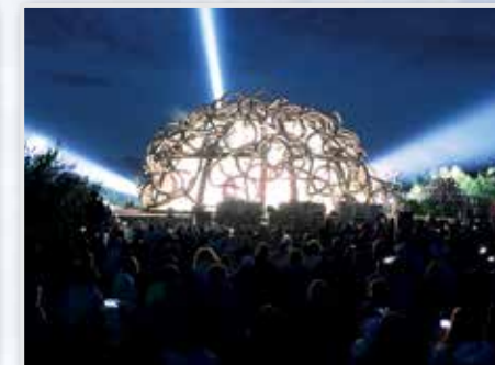
Арт-парк «Никола-Ленивец» д. Никола -Ленивец

www.nikola-lenivets.ru 8 (920) 090-22-60