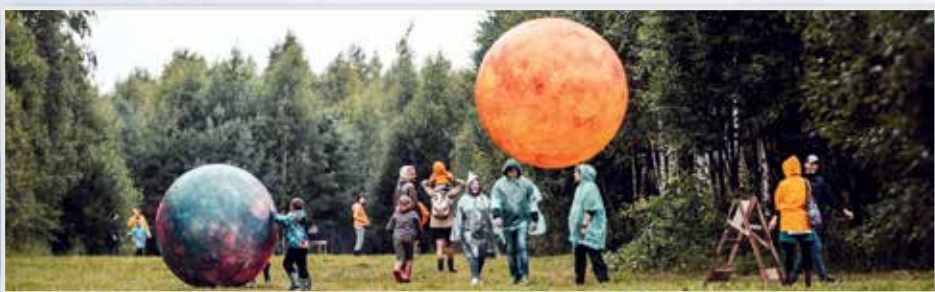
Арт-парк «Никола-Ленивец» д. Никола-Ленивец

www.nikola-lenivets.ru 8 (920) 090-22-60