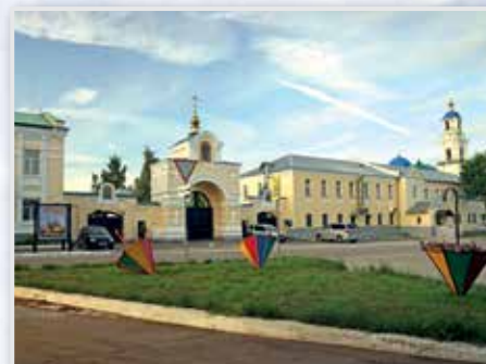
Калужская Свято-Тихонова пустынь с. Льва Толстого

Сам храм внутри украшают дубовыми ветвями. Основные мероприятия по случаю Дня памяти преподобного Тихона Калужского божественные литургии и водосвятный молебен.