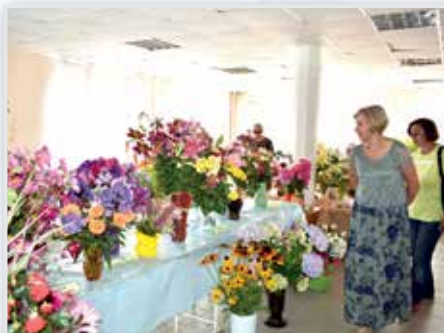
г. Кондрово, ул. Кутузова, д. 1