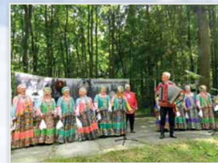
Музей-усадьба «Полотняный Завод» п. Полотняный Завод, ул. Трудовая, д. 2а

www.pzapovednik.ru 8 (48434) 7-43-79, 8 (953) 337-71-73, 8 (915) 891-67-93