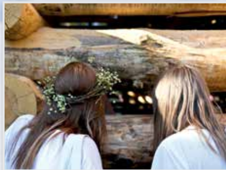
Арт-парк «Никола-Ленивец» д. Никола -Ленивец

www.nikola-lenivets.ru 8 (920) 090-22-60