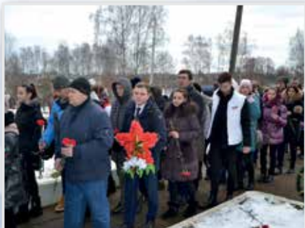
Братское захоронение, г. Кондрово, территория городского кладбища.