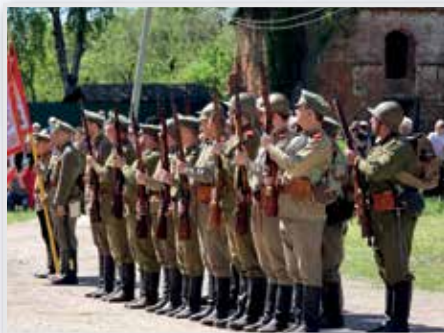
Музей -усадьба «Полотняный Завод» п. Полотняный Завод, ул. Трудовая, д. 2а

www.pzapovednik.ru 8 (48434) 7-43-79 8 (953) 337-71-73, 8 (915) 891-67-93