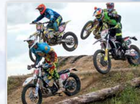
п. Полотняный Завод, станция «Шаня»