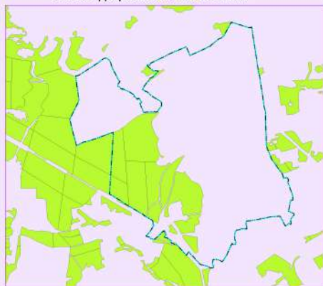
МО ГП "Город Кондрово" Кондровское уч. лесничество ГКУ КО "Дзержинское лесничество"